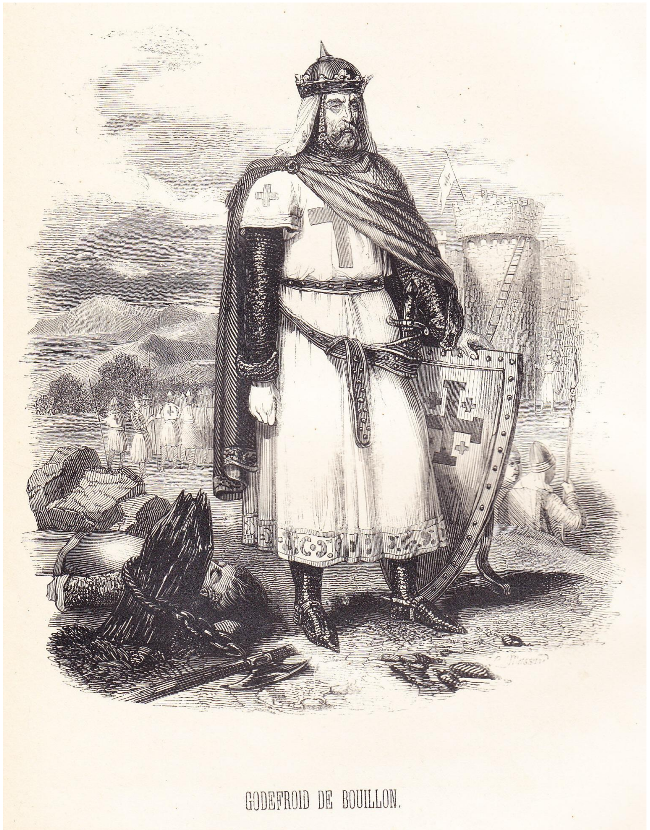
GODEFROID DE BOUILLON.

Entre les pages 56-57 * de Belges illustres 1 (1844).