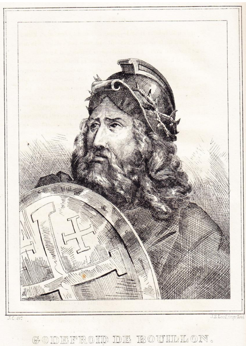
“Godefroid de Bouillon”

Il nous a semblé intéressant de proposer, à titre de comparaison, des gravures relatives au même thème qu'ont réalisées ultérieurement certains de ses contemporains.