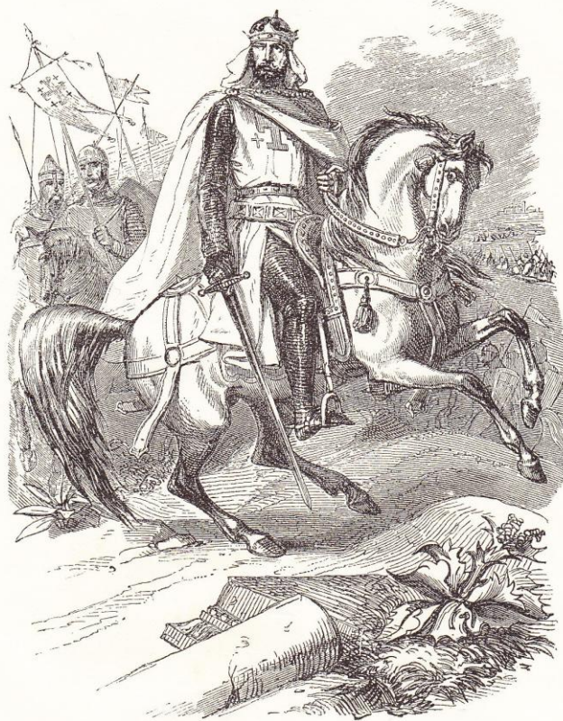
GODFRIED VAN BOUILLON.

domeinen zijner familie en zijn graafschap Verdun, dat zijne tegenstrevers hem dadelijk bij zijn terugkeer in België hadden afgestaan, tevreden. Hij had, van den anderen kant, van Boulogne en van zijn vaderlijk erfdeel, dat hij aan zijnen broeder Eustacius afstond, afgezien, niet denkende dat de eer hem toeliet, tevens leenheer van den koning van Frankrijk en van den keizer van Duitschland te zijn. Zijn gedrag was altijd even edelmoedig en belangeloos. Maar