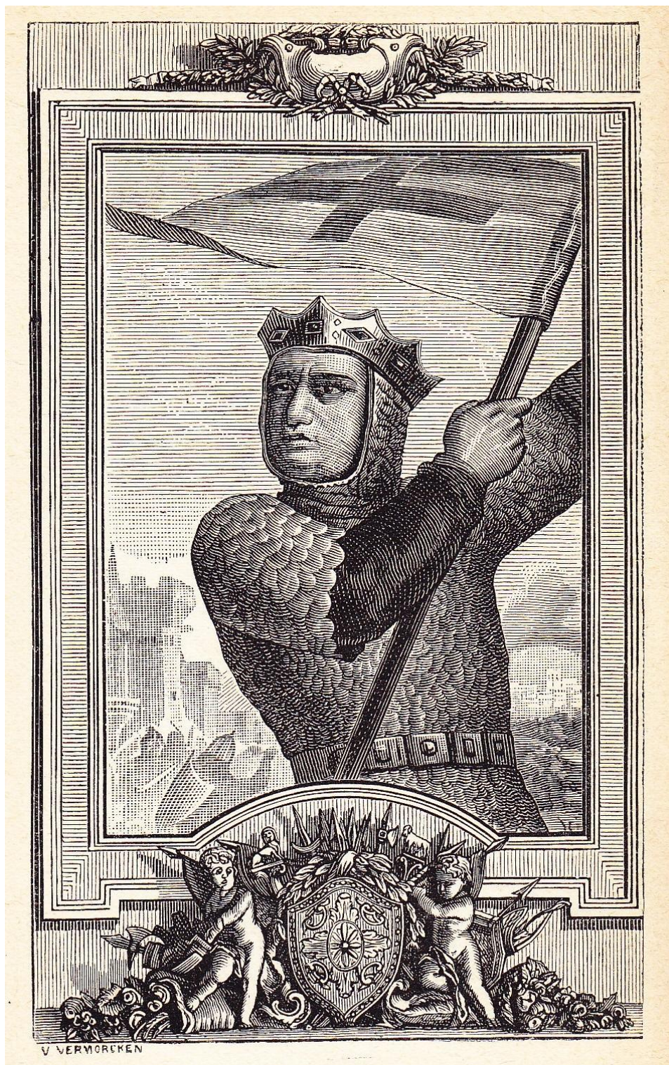
En frontispice de de « Godefroid de Bouillon » par HARTHAUG.