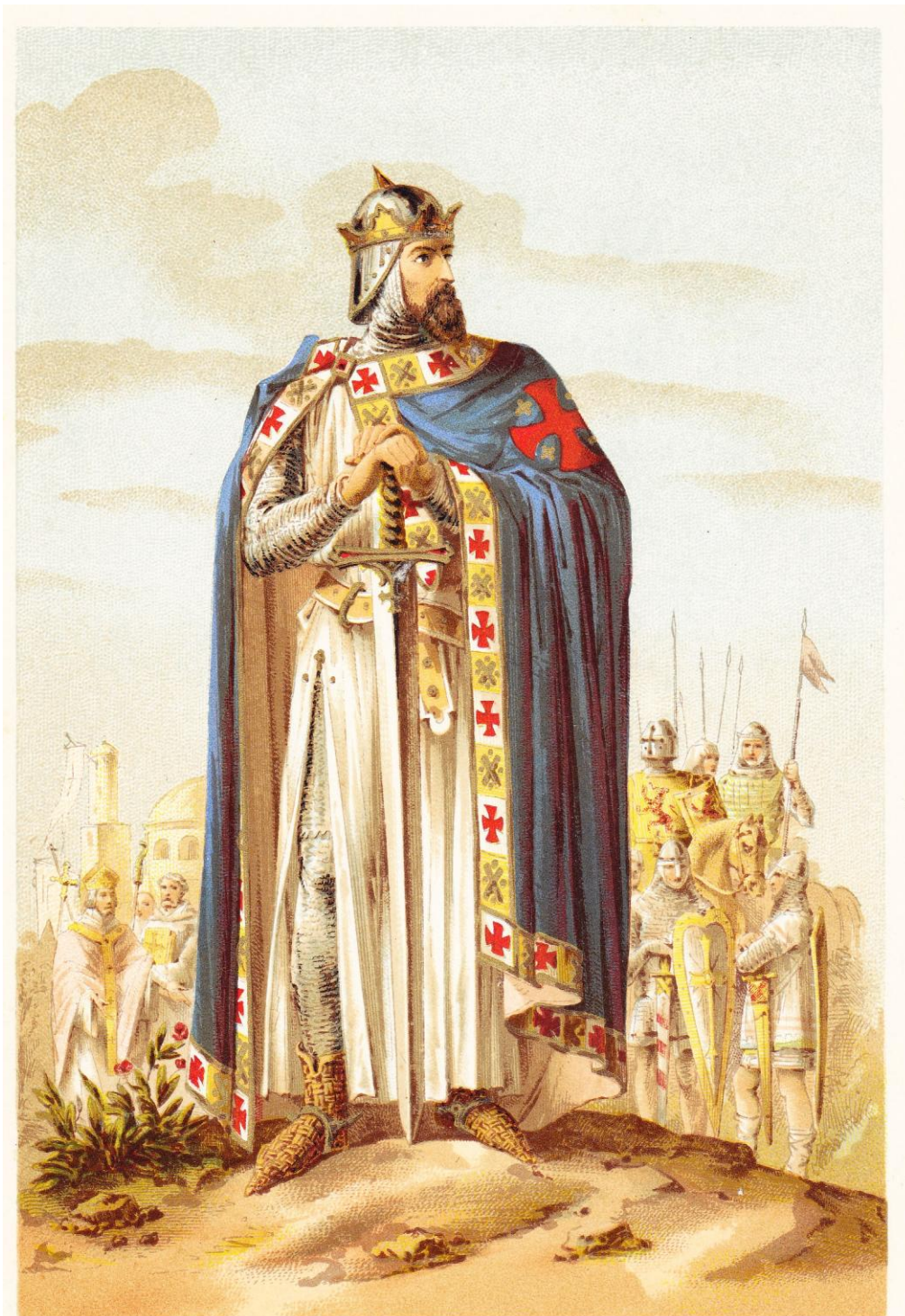
G. Severeys, Chromolith.